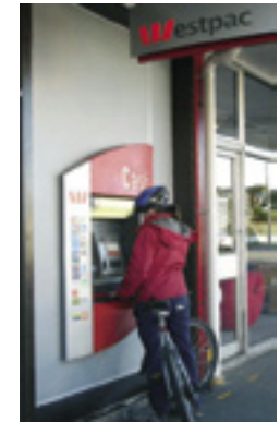
Ansicht einer ATM Christchurch, Neuseeland

Kunden der Citibank erhalten ebenfalls gebührenfrei Geld an den hauseigenen Geldautomaten; die Anzahl der kostenfreien Transaktionen ist allerdings meist begrenzt. Zudem sind Citibank-Automaten in Australien und Neuseeland eher selten zu finden. Vorteilhaft ist dagegen die Möglichkeit, kostenfrei aus fast allen Ländern Geld zu überweisen, weil so nicht unbedingt ein Konto vor Ort eingerichtet werden muss.