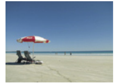
... in Neuseeland (S.102) oder in Australien

Allerdings ist es nicht zu empfehlen, nur für einen zweiwöchigen Sprachkurs nach Australien oder Neuseeland zu reisen, denn bevor man überhaupt den Jetlag überwunden hat, muss man schon wieder zurückfliegen. Die meisten deutschsprachi-