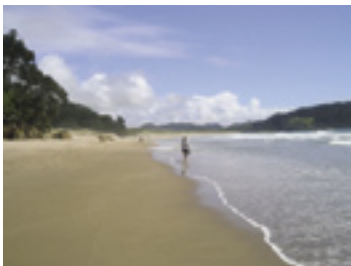
Nach dem Sprachkurs an den Strand...